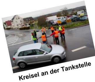
Kreisler an der Tankstelle