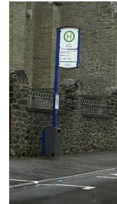
Barrierefreier Zugang zu allen Bushaltestellen