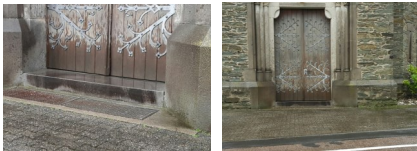
Barrierefreier Eingang zur Kirche