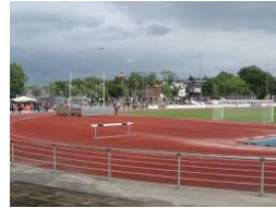
Sport- und Kulturzentrum